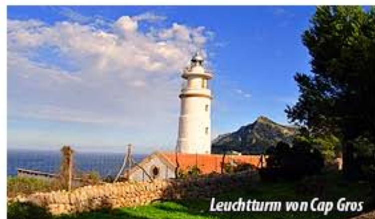
Leuchtturm von Cap Gros