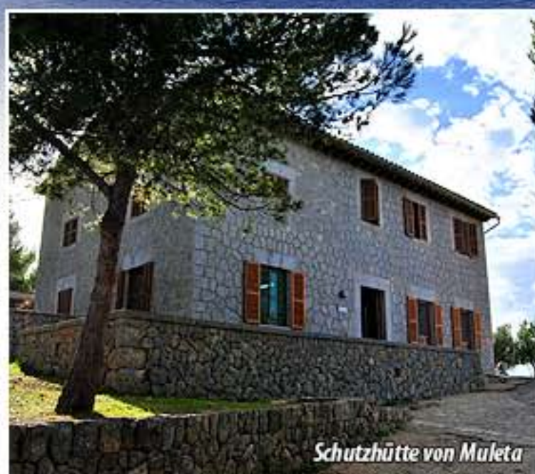
Schutzhütte von Muleta

Nachdem wir das alte Hotel hinter uns gelassen haben, gehen wir weiter geradeaus, bis wir an eine Abzweigung kommen. Im Schatten von einem Johannsbrotbaum beginnt der Hufeisenweg. Wir folgen einem schönen steingepflasterten Bergweg, der uns, wenn wir uns rechts halten nach Muleta durch einige Olivenbäume führt. Nun lassen wir die Häuser von Muleta de Ca s'Heuer hinter uns. Kurz danach, nachdem wir den Sturzbach überquert haben, kommt man zu den Häusern von Muleta Gran , wo man den herrlichen Verteidigungsturm besichtigen kann. In der Nähe von diesem Turm gehen wir an einer Lehmmauer vorbei in Richtung Norden, unmittelbar stoßen wir auf eine Abzweigung. Der links abbiegende Weg führt nach Coll de Can Bleda und zum Weg von Castelló , wir wählen den Weg, der uns zum Leuchtturm von Cap Gros bringt.